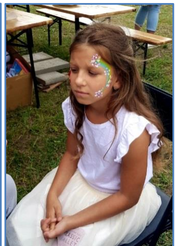
Malování na obličej bylo atraktivní pro děti. Měli z toho radost.