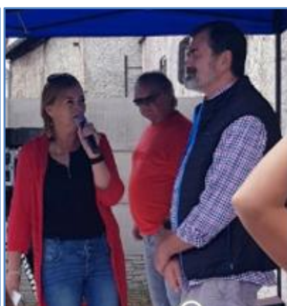
Přivítání na akci