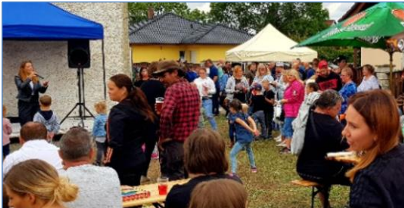
Dětský den v našem muzeu v Bezděkově.

reportáž Vlád'a Ligda, podklady Franta Blahout