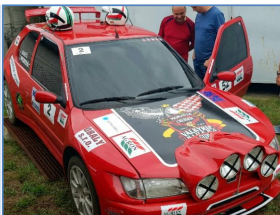
Sporták pro projížďku