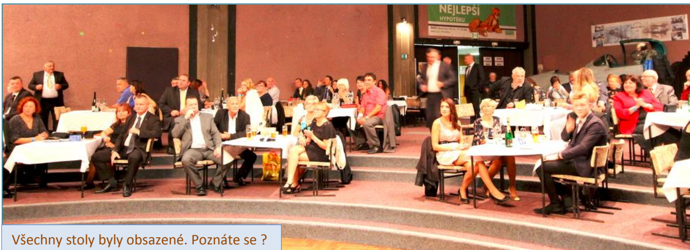
Všechny stoly byly obsazené. Poznáte se ?