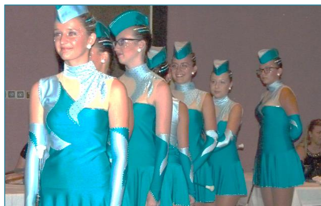
Taneční zahájení patřilo krásným mažoretkám z Podbořan. Ladné linie, práce s hůlkou – hezké.