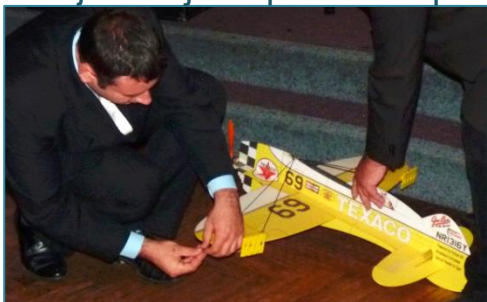
Malé letectvo, ale perfektní let.