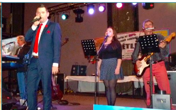
Hudební skupina REFLEX