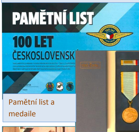
Pamětní list a medaile

Po další krátké sérii od skupiny Reflex nastal slavnostní akt předání leteckých medailí k stému výročí založení čs. letectva. Samozřejmě medaile předával, kdo jiný než náš bývalý velitel pluku.