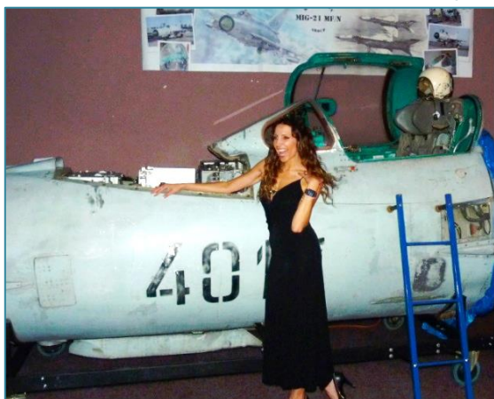
Pozornost přitahoval nejen výše zmíněný letoun, ale i krásné zpěvačky.

Na letošní 3. novodobý ples se snad těšili všichni, co měli, nebo mají něco společného s letectvem. Předchozí dva plesy založily tradici a nastavily pomyslnou laťku. Organizátorem byl pověřen opět zkušený Jirka Rámeš. Ale letos již měl přece jen jistotu, že neproděláme a zajistíme vysokou úroveň. Pomoc všech byla nasnadě. Kulturní dům Moskva byl v podvečer plesu vyzdoben logy partnerů, Český svaz letectví, bývalého 11. slp a letek. Sál byl opět vybaven zvukovou a promítací technikou. Do sálu byla umístěna tunová kabina MIG-21 MF