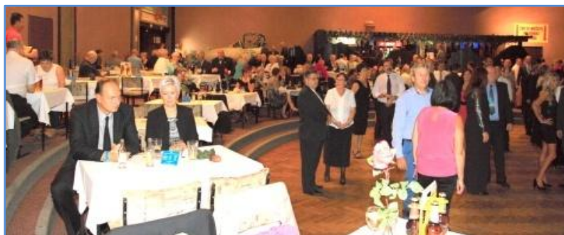
Taneční parket se zaplnil hned po úvodních tónech kapely