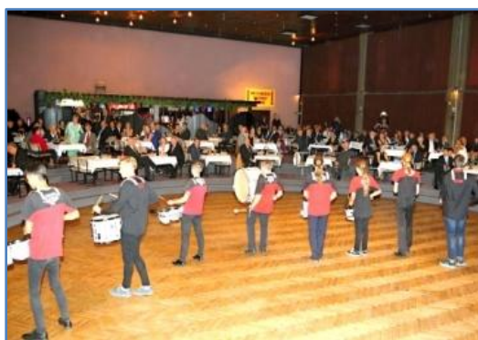
Ples zahájili prvotřídní bubeníci z Karlových Varů se svým show, při kterém dostávaly ušní bubínky pořádně zabrat, ale bylo to úžasné antré celého večera.

Do sálu byla umístěna téměř tunová kabina MiGu 21 s přední částí. Tato atrakce každého zaujala a nebylo snad jediného účastníka plesu, který by se v ní nevyfotil s pilotní přilbou na hlavě.