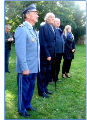
Příhlížející – většinou příslušníci naší organizace Letci - Žatec