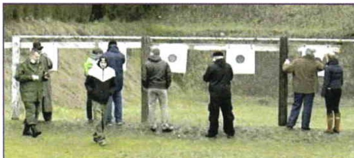
Soutěžící spěchají k terčům a hledají otvory po svých výstřelech. Ty pak zalepují páskou.

Proto nebylo lehké na něm nasbírat body do celkového pořadí. Nestačilo trefit terč, tzv. desítku, střelec musel v terči zasáhnout malou černou výseč, ve které se zásahy počítaly jako dvojnásobek bodů klasického terče. Takže i v chladném počasí se řada střelců při míření na tento terč pořádně zapotila. Po tomto střeleckém klání si mohl každý vystřelit ze své soukromé zbraně nebo z dalších střelných zbraní, které na toto setkání přinesli někteří účastníci. Šlo o dobové i kuriozní zbraně, muškety, perkusní pušky a pod. Po výstřelu z těchto zbraní pro oheň a kouř nebyl vidět ani samotný střelec. Toho využili jen jedinci, kteří nedisponují pudem sebezáchovy, nebo jsou opravdovými skalními fanoušky a obdivovateli těchto zbraní. Naštěstí nikdo nepřišel k žádnému vážnému úrazu.