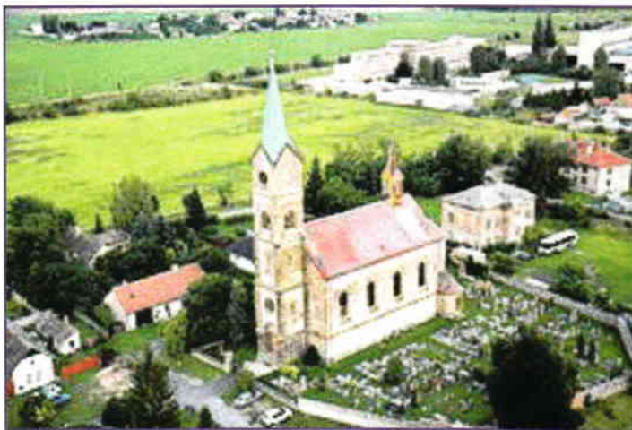
Část malebné vesničky Dvory, okres Nymburk