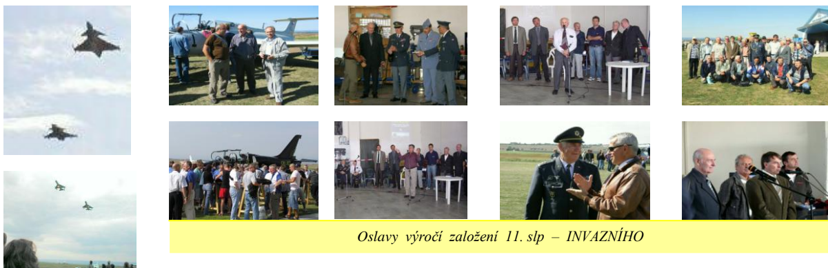
Oslavy výročí založení 11. slp – INVAZNÍHO