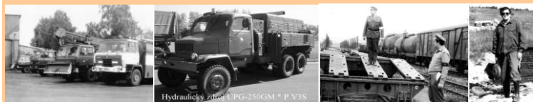
Technická hotovost P V3S hydraulika Železniční vlečka Pyrotechnik