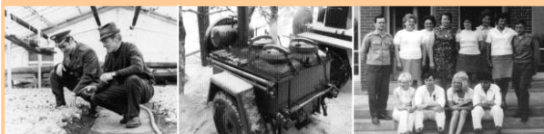
Vlastní hospodářství Polní kuchyně Kolektiv jídelny