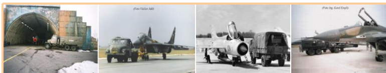
Aktivovaný ÚL Tahač s Migem 29A M - 21PFA EZOP M-29A a SUEZ