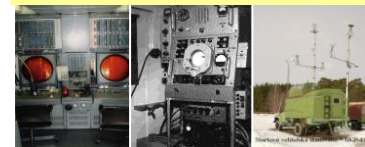
Pracoviště ŘP Startové VS