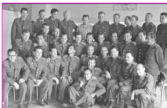
Štáb pluku z roku 1969