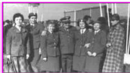
to hezcí osazenstvo štábu