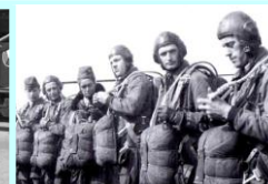
Příprava na seskoky padákem

Celému útvaru velí velitel pluku, jeho prvním podřízeným byl zpravidla náčelník štábu.