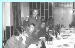
Toto jsou jen malé skupinky příslušníků inženýrské služby, bez nich by piloti nevlétli, spolehliví dřiči, odborníci na slovo vzatí a dobří kamarádi