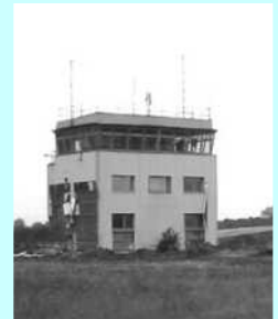
Věž, pracoviště ŘL, dispečérů a meteorikářů