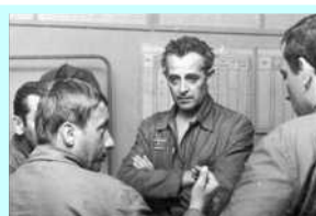
Část letové skupiny porada před letovou akcí