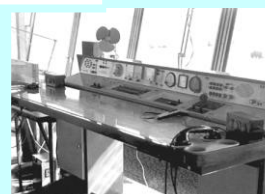
Kontrolní věž pracoviště řídicího létání