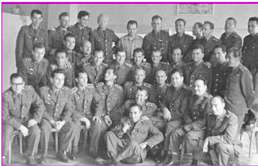
Štáb pluku z roku 1969