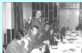
Toto jsou jen malé skupinky příslušníků inženýrské služby, bez nich by piloti nevlétli, spolehliví dřiči, odborníci na slovo vzatí a dobří kamarádi