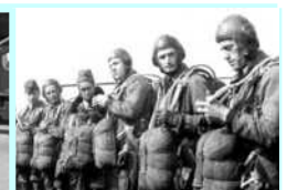
Příprava na seskoky padákem

Celému útvaru velel velitel pluku, jeho prvním podřízeným byl zpravidla náčelník štábu.