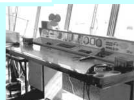
Kontrolní věž pracoviště řídicího létání