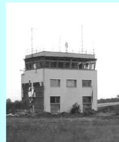
Věž, pracoviště ŘL, dispečerů a meteorikářů