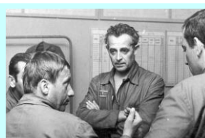
Část letové skupiny porada před letovou akcí