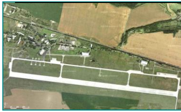
Takto vypadalo letiště před likvidací