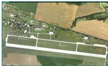
Takto vypadalo letiště před likvidací