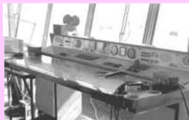
Pracoviště řídicího létání Pracoviště letovoda