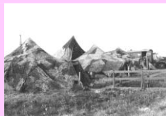
Zamaskovaná technika v polních podmínkách