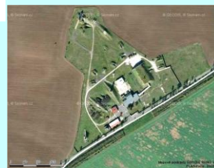
Velitelské stanoviště 11.slp LAŽANY