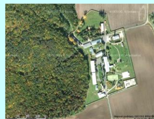
VS 3.d PVOS VĚTRUŠICE