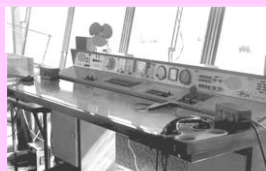
Pracoviště řídicího létání Pracoviště letovoda