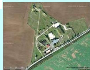
Velitelské stanoviště 11.slp LAŽANY