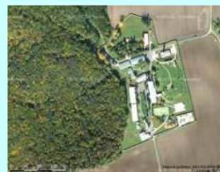
VS 3.d PVOS VĚTRUŠICE