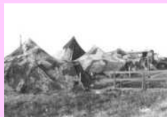
Zamaskovaná technika v polních podmínkách