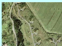
Rozptylový prostor RP 3 Žiželice