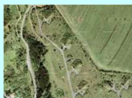
Rozptylový prostor RP 3 Žiželice