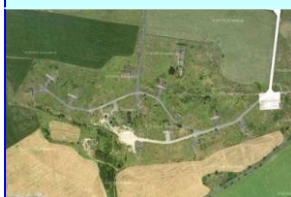
Rozptyl RP 2 Staňkovice ÚL – úkryt letounu