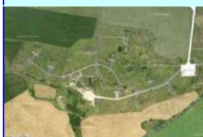
Rozptyl RP 2 Staňkovice ÚL – úkryt letounu