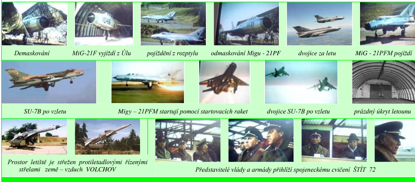
Demaskování MiG-21F vyjíždí z Úlu pojiždění z rozptylu odmaskování Migu - 21PF dvojice za letu MiG - 21PFM pojíždí

Následující snímky jsou unikátní, omlouváme se však za jejich zhoršenou kvalitu, vniklou jejich kopírováním z videozáznamu.