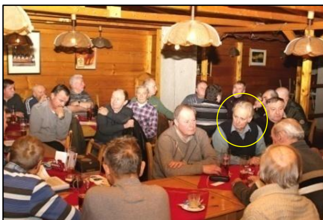
mezi kamarády na některé z členských schůzí našeho spolku Letci - Žatec