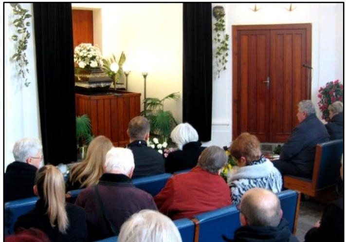
Smuteční obřad končí, rakev se zesnulým kamarádem odjíždí do neznáma.