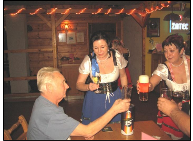
Jirka byl milovníkem a chovatelem koček, ale líbily se mu i ty dvounohé

Jirka měl dlouhodobé zdravotní potíže, byl v neustálé zdravotní péči lékařů, ale přes jejich veškerou snahu o záchranu jeho života se jeho zdravotní stav nestále zhoršoval, až ataku choroby 9. 11. 2018 podlehl. Poslední rozloučení s Jirkou se konalo 15. 11. 2018 ve smuteční síni v Berouně.