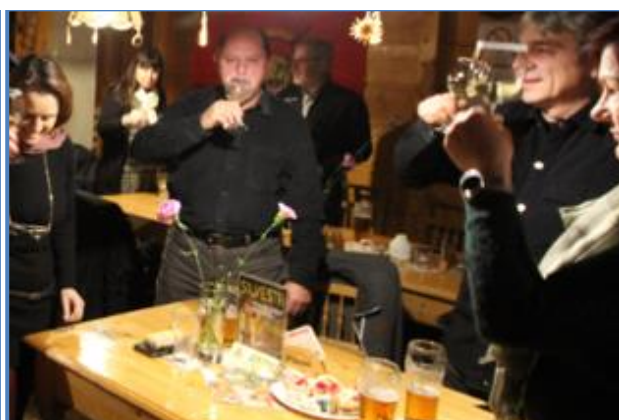
a ostatní veteráni při přípitku.

Protože se neřešily žádné obvyklé záležitosti týkající se činnosti spolku, velice rychle se rozproudila bujará zábava, u které nechyběl tradiční životabudič, jinak řečeno – každý vlastenec veterán objednával panáčky. Díky svižně obsluhujícímu Radkovi vše probíhalo hladce, neboť Radek dobře ví, kdo co pije a co má rád. Fernetík střídal Fernetík, a i sem tam Becherovka se střídala s Vodečkou. Ach jó.